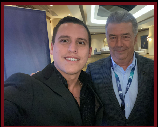
PEDRO TRUEBA (EX PRESIDENTE AMPI)