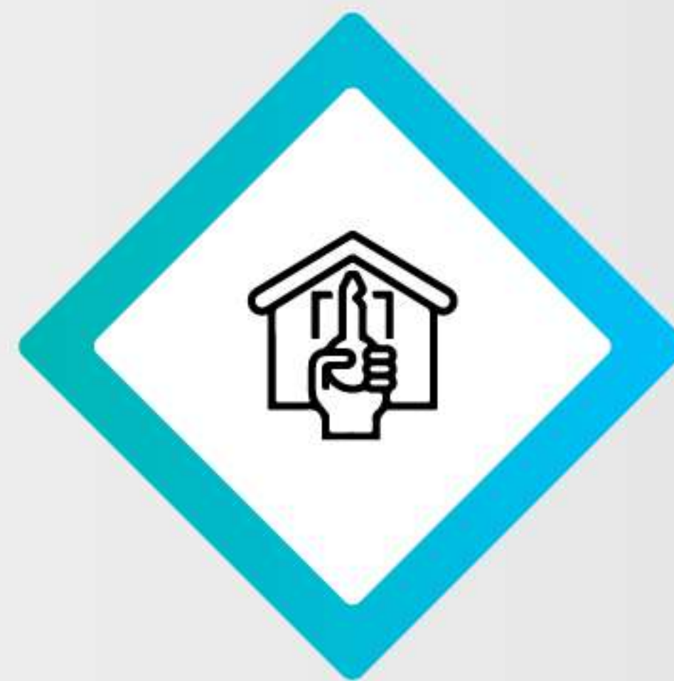
DUEÑO DE FRANQUICIA