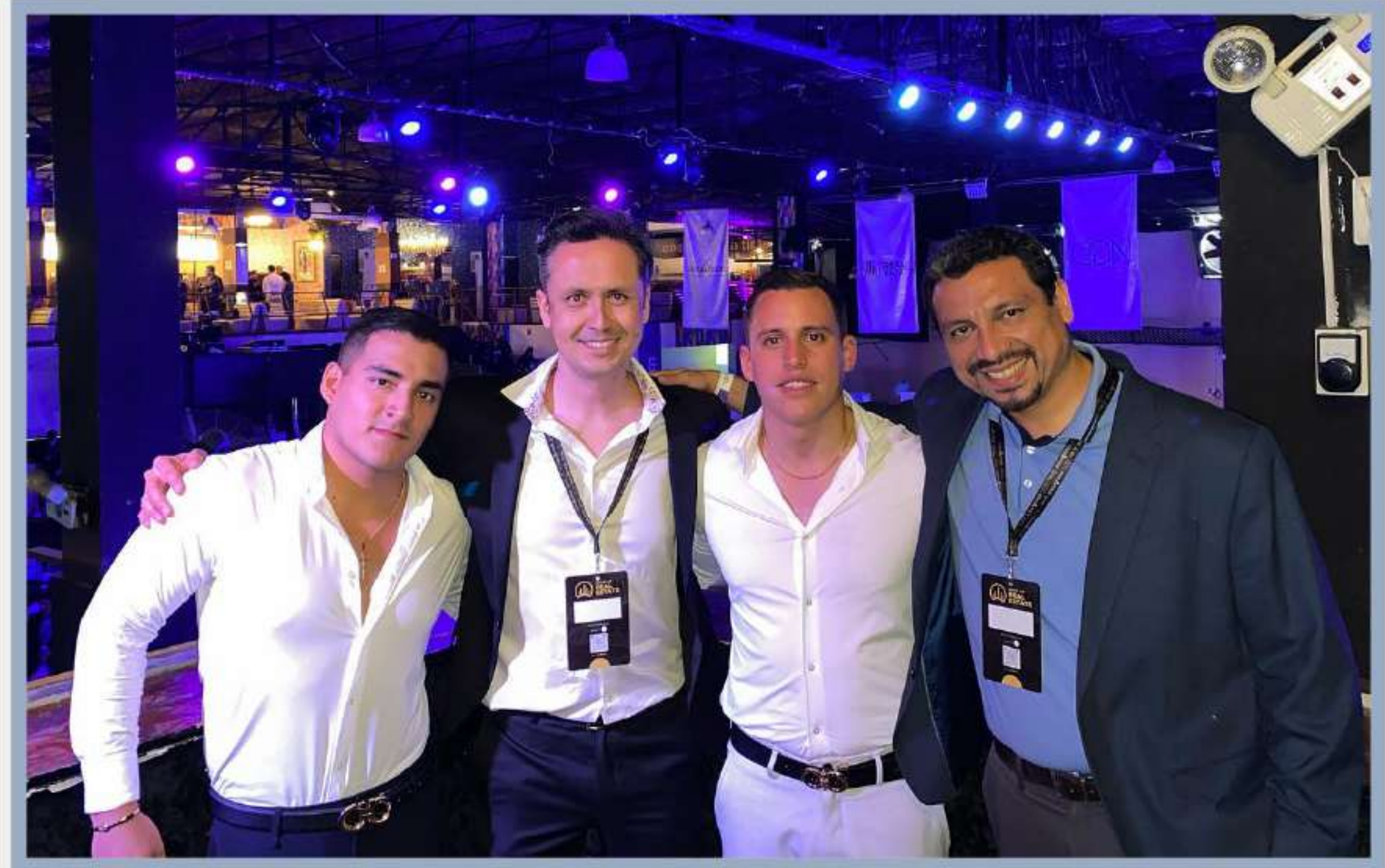
• 4S REAL ESTATE PERÚ (CONSULTORA INMOBILIARIA)