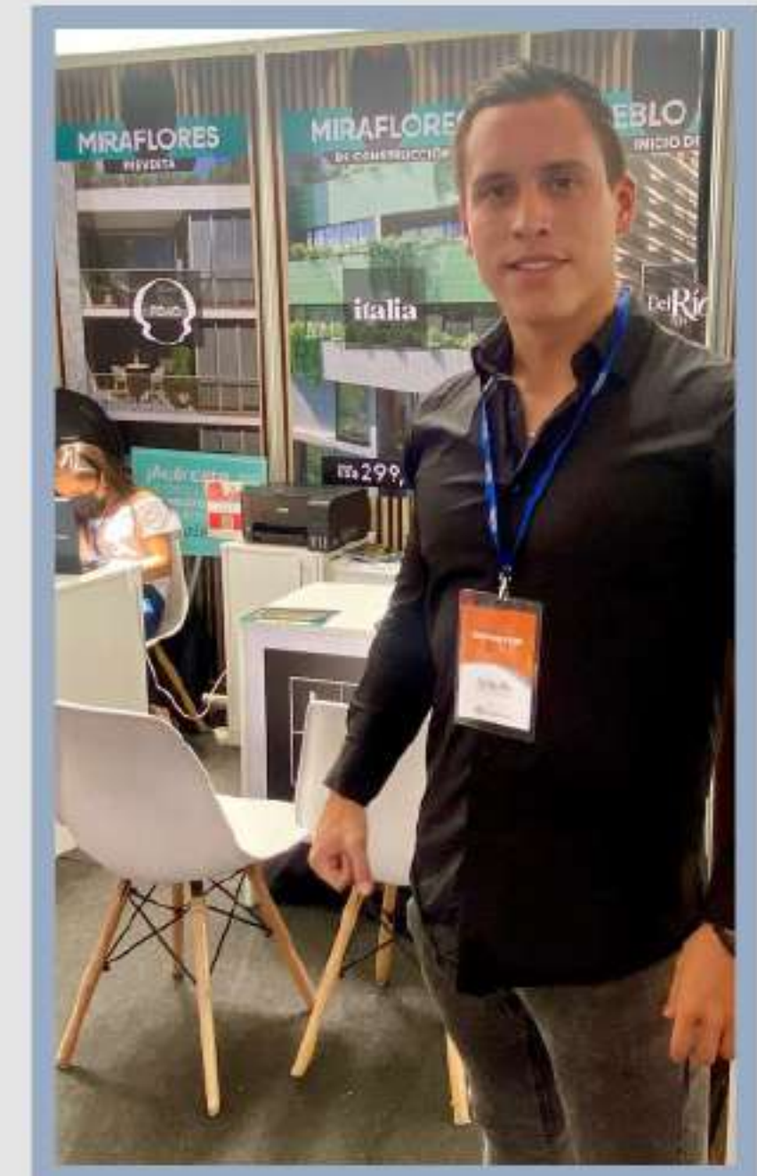
• FERIA NEXO