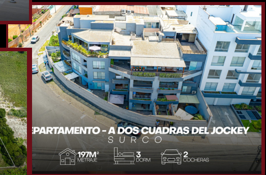
DEPARTAMENTO - A DOS CUADRAS DEL JOCKEY SURCO