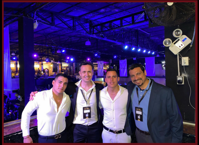
4S REAL ESTATE PERÚ CONSULTORA INMOBILIARIA