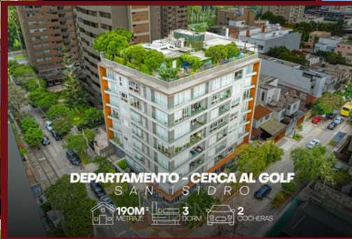
DEPARTAMENTO - CERCA AL GOLF SAN ISIDRO