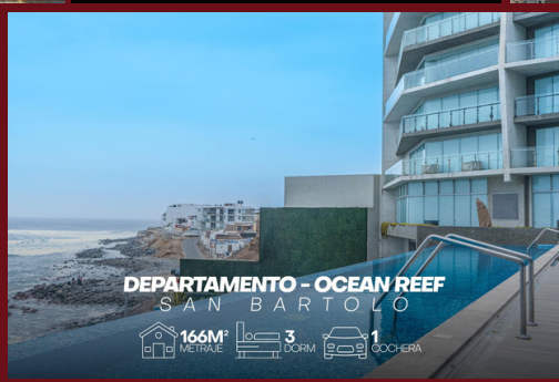
DEPARTAMENTO - OCEAN REEF SAN BARTOLO