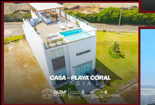
CASA - PLAYA CORAL ASIA