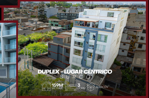
DUPLEX - LUGAR CÉNTRICO SURCO