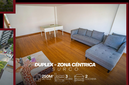
DUPLEX - ZONA CÉNTRICA SURCO