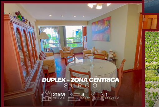
DUPLEX - ZONA CÉNTRICA SURCO