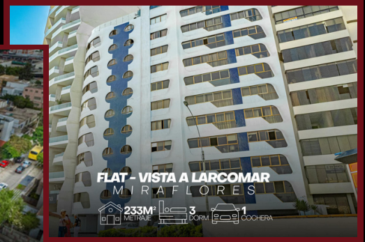
FLAT - VISTA A LARCOMAR MIRAFLORES