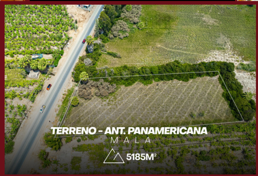
TERRENO - ANT. PANAMERICANA MALA