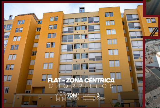
FLAT - ZONA CÉNTRICA CHORRILLOS