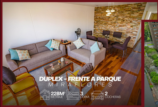
DUPLEX - FRENTE A PARQUE MIRAFLORES