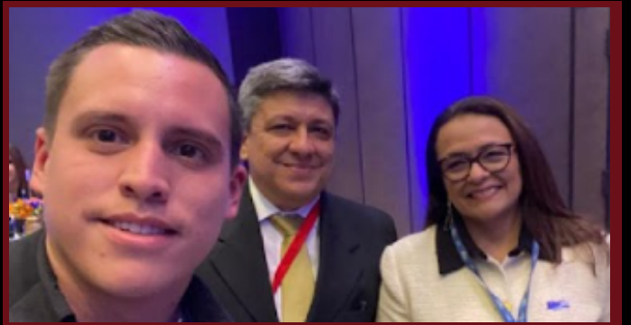
CARMEN LEGADOS (VICEMINISTRA DE VIVIENDA DEL PERÚ)